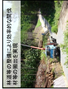
林道等の整備により効率的な間伐材等の搬出を実現