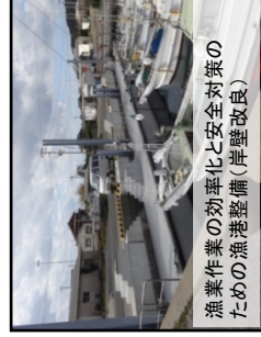
漁業作業の効率化と安全対策のための漁港整備(岸壁改良)