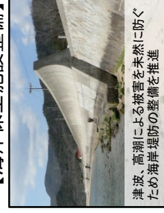
津波、高潮による被害を未然に防ぐための海岸堤防の整備を推進