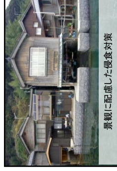
景観に配慮した侵食対策