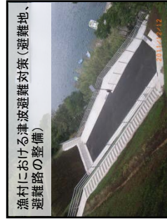
漁村における津波避難対策(避難地、避難路の整備)