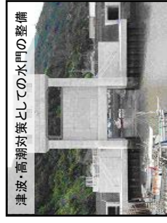
津波、高潮対策としての水門の整備