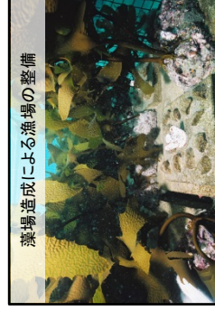
藻場造成による漁場の整備