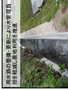
用水路の整備・更新により水管理負担を軽減し農地利用を推進