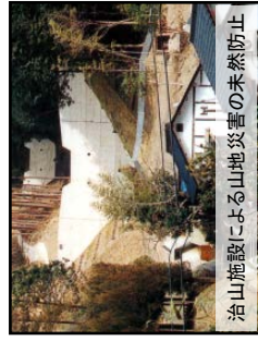
治山施設による山地災害の未然防止