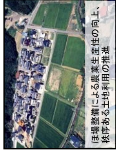
圧壊整備による農業生産性の向上、秩序ある土地利用の推進