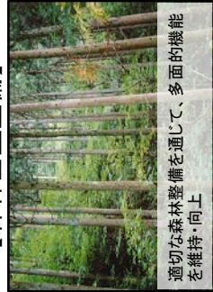
適切な森林整備を通じて、多面的機能を維持・向上