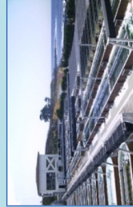
魚類・貝類種苗生産施設