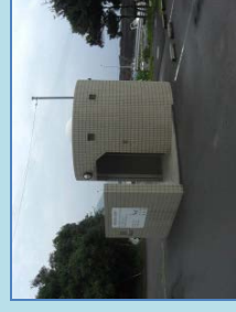
漁港環境整備施設