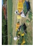
障害者による玉ねぎ収穫