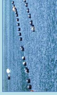
カキ・ホタテ等養殖施設