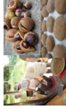
地域産品の加工・商品化

○市町村等が作成する活性化計画に基づき、農山漁村における定住や地域間交流の促進、所得の向上や雇用の増大を図るために必要な生産施設、生活環境施設及び地域間交流拠点施設等の整備を支援