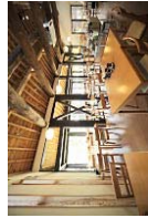
農家レストランの整備