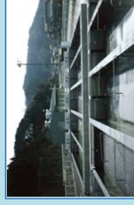
さけ・ます種苗生産施設