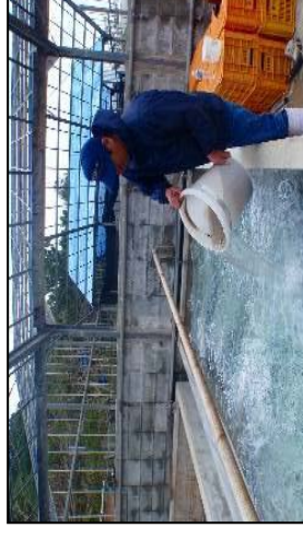
モズクの新規養殖