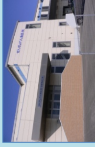
水産加工処理施設