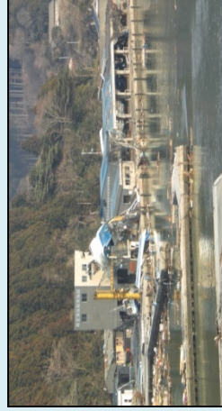
荷捌き施設と製氷施設