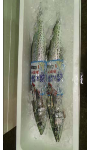
サワラ高付加価値化