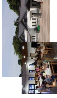
漁業体験学習施設