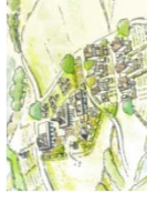
農家住宅構想策定