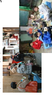
体験プログラム作成