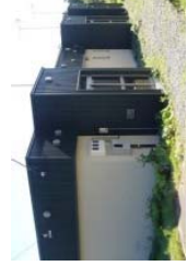
定住希望者の一時滞在施設