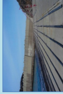
岸壁等の軽劣化施設