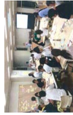
体制づくりのための話し合い