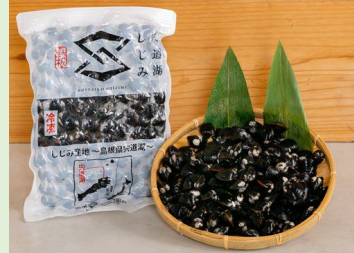
冷凍シジミのオンライン販売