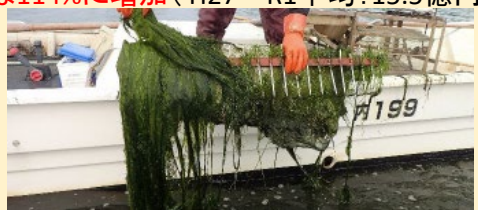
藻類・水草類の除去