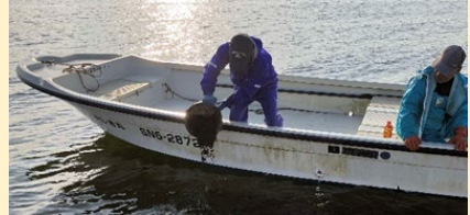
天然採苗と稚貝放流による資源増殖