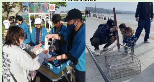
「しじみの日」イベントの様子