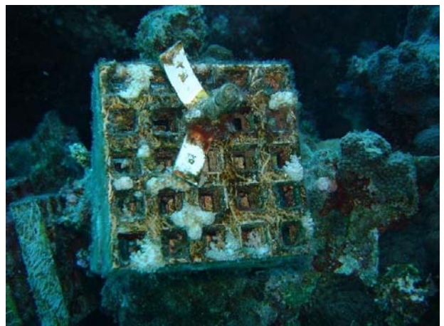
写真Ⅱ-6-1-1 移植サンゴのモニタリング(第5次調査分)