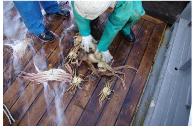
籠の中から取り出したズワイガニ