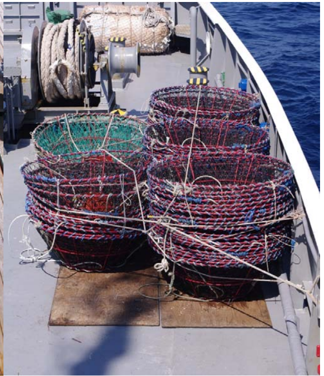
押収したかに籠漁具（籠、ブイ及びロープ）