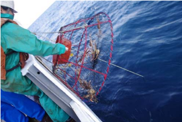
海中から引き揚げられたかに籠