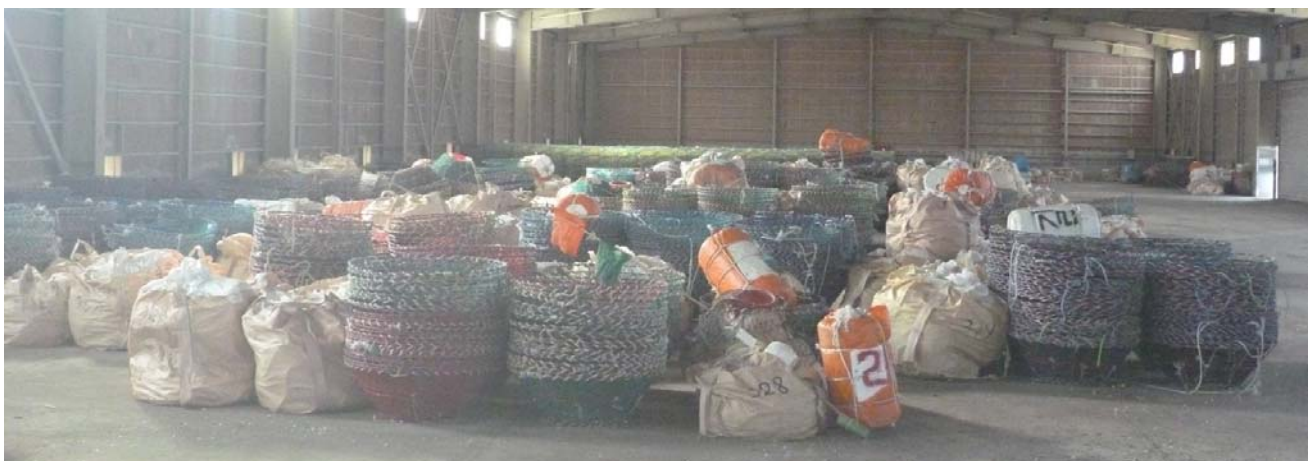
押収漁具の保管状況